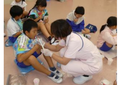
みがき残しのチェック