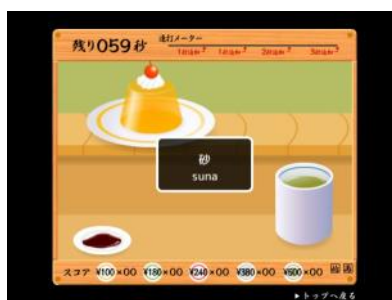
インターネット上にあります

4-6年生を対象に、自由参加で行いました。（低学年はまだタイピングは難しいです。高学年を対象にしました。）ネットのタイピング練習サイトがあり、回転すしのレーンに乗って課題が出されます。その課題をタイピングします。今回は1分間でどれだけ正確に入力できるかを競いました。はたして誰が一位になったのかな？