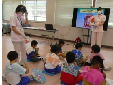
歯科衛生士さんの説明

成田市健康増進課から歯科衛生士さんにお越しいただき、3年生が歯磨き指導を受けました。ここ数年、学校ではコロナ対策として、みんなで一緒に歯磨きをすることはありません。上手に歯磨きができていないかどうかが確認するいい機会になりました。自分では磨いたつもりになっていても、歯の間や奥歯には磨き残しがあることがわかりました。歯は大切です！