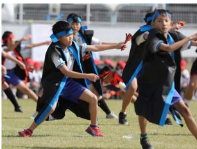
5・6年 よいさこいソーラン