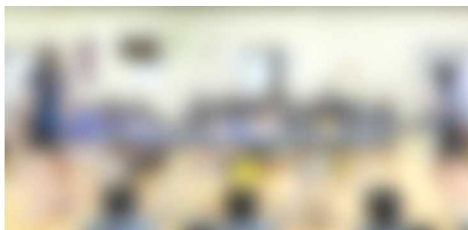
【ドライブが決まった！女子卓球部】