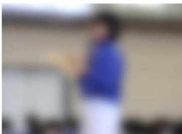
【昼の放送を盛り上げる放送委員会。今年も、楽しい企画をお願いします】

行事の中心になる委員会や、日常生活を地道に支える委員会など、それぞれの役割や意味があります。希望の委員会になれなかった人も、次の機会を待ちつつ、よりよい学校生活のために、行動してみましょう。