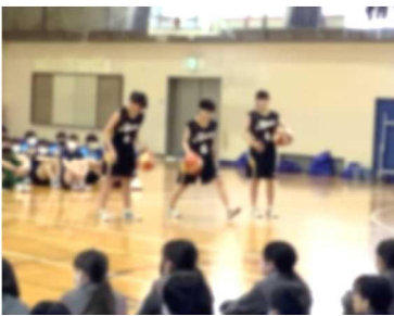
【女子バスケの華麗なボールさばき】