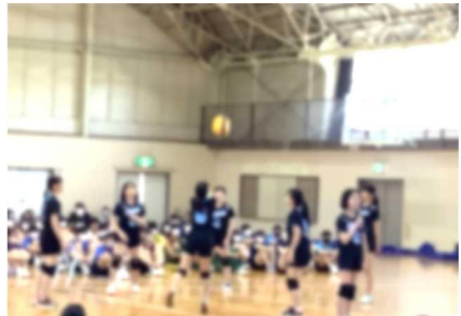
【正確な円陣パスの女子バレー】