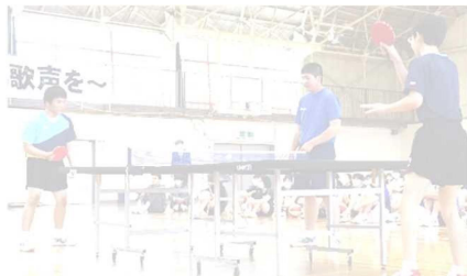
【3本マッチを披露した男子卓球部】