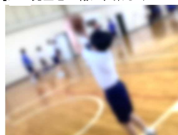
【狙えゴール!バスケ!】