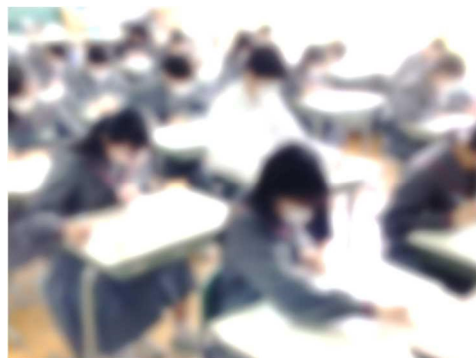
【国語の調査問題に挑戦中。記述問題にもあきらめずに取り組みます】