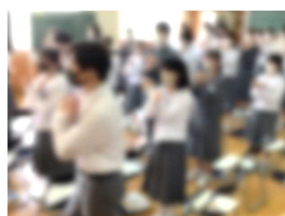
【一糸乱れぬチームワークでボディ・パーカッションを楽しむ2年生。テンポが速くなっても、息ぴったり。終始笑顔で、いい雰囲気でした】