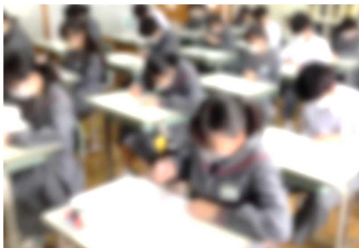
【こちらは数学。問題文を読み、図やグラフや表も読み解かないといけないので、たいへん】

この調査問題の特徴は、単なる知識や技能を問うだけでなく、話合い、自己表現や意見表明、根拠を明らかにして説明するなど、身に付けた知識や技能を、どのように活用できるかを、問うところにあります。