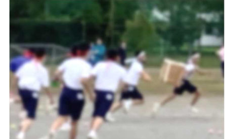
【2年生の追いかけ玉入れ! 籠の生徒は、逃げるだけでなく、体をひねって玉をよけるなど、なかなかの技巧派です】