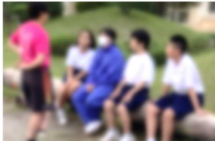
【先生と1年生リーダーたちが、競技の打合せ中。自分たちの考えをしっかり持って行動しています】

インフルエンザが猛威を振るい、日程変更や学級閉鎖などの措置を執っています。保護者の皆様にも、ご心配をおかけし、申し訳ありません。