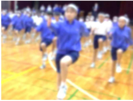
【29日(月)は雨のため、体育館で入場行進の練習を実施。これもまた大切な演技の一つ。全員の足を、ぴたっと止められた瞬間は、感動しましたね】