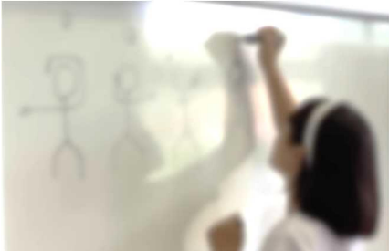
【「のりのリコーン」の踊りを図解してくれる白組団長。私も、見よう見まねでやってみましたが…すみません。全然覚えられません】