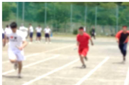
【予行練習で突如始まった先生レース。先生・先生・先生が猛然とダッシュ】