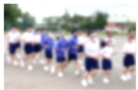
【30日(火)は昼から晴れたので、昼休みにリレー選手が集まり、入退場の動きを、走りながら確認しました】