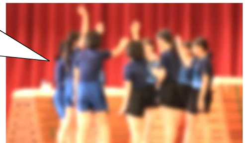
【女子卓球部：個人戦・7/8 団体戦 7/21・22】

女子卓球部は、団体戦で県大会への出場を目標に、日々、練習に取り組んできました。これまで、私たちを支えてくださった顧問の先生方を始め、コーチの方、保護者への感謝の気持ちを持ち、練習してきた成果を発揮できるよう頑張ります。応援よろしくお願いします！最後に円陣を組みます！