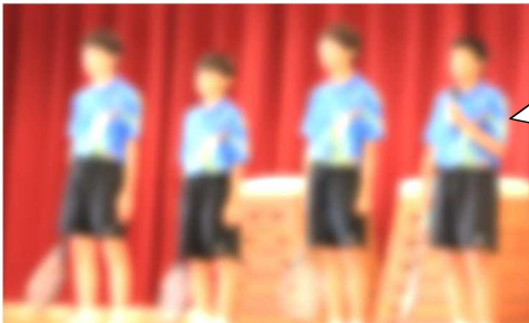
【男子テニス部：団体戦・7/15】

陸上競技部は、自己ベストの更新や、入賞を目指して、いろいろな大会に出場してきました。最後の大会である総体に向けて、一生懸命練習し、全員が自己ベストを出せるように頑張ります。応援、よろしくお願いします！