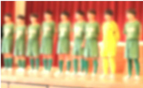
【サッカー部：7/15・16・21・22】

6月29日(木)、夏の総合体育大会やコンクール等に向けての、部活動壮行会が実施されました。各部活動がステージに立ち、3年生としては、集大成とも言える「最後の夏」に向けて、これまでの感謝の気持ちと、みなぎる決意が語られました。