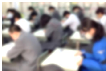
【学力の他に、気力、体力、集中力も重要です。日頃の積み重ねがものを言います】

テストの結果から、似たような問題を解き直したり、教科の先生にもう一度質問しに行ったり……日々の学習を工夫してみましょう。