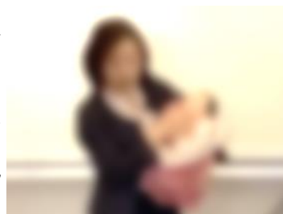
【講師の先生が抱っこしている新生児人形は、重さ3kg。生徒も代わる代わる抱っこして、戸惑ったり、にこにこしたりしていました】

保護者の皆さんが実体験として話す、たいへんだったことや、うれしかったことなど……子どもたちは、しみじみと耳を傾けることと思います。