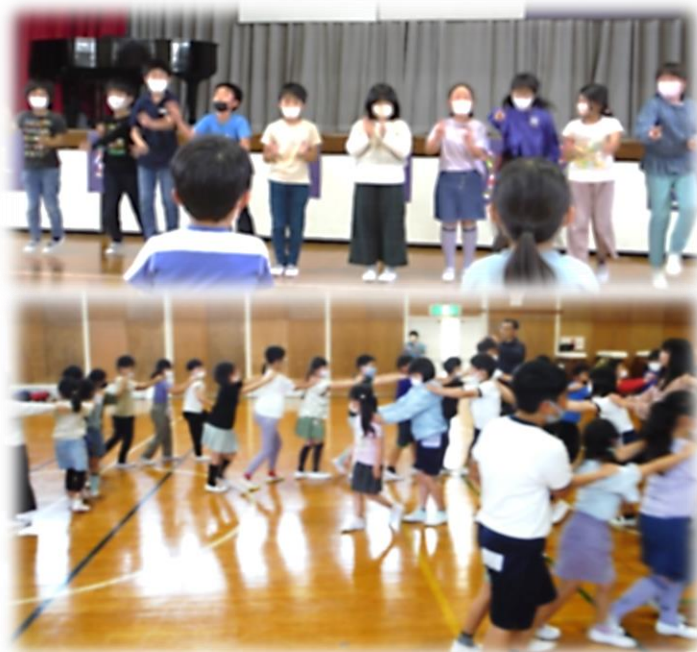
お楽しみレク(かもつれっしゃ)