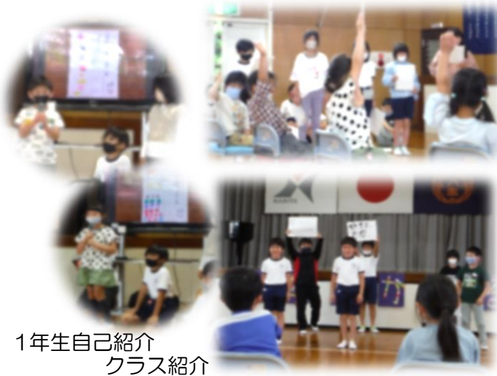
1年生自己紹介 クラス紹介

4月28日(金)に代表委員会が中心になり、1年生を迎える会が行われました。会では「1年生の自己紹介」、「2～6年生のクラス紹介」、「お楽しみレク(かもつれっしゃ)」がありました。1年生を温かく迎え、全校みんなで楽しく過ごすことができました。