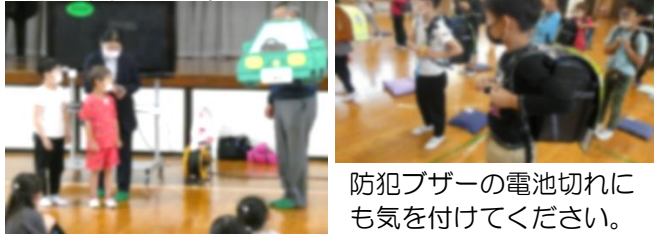
防犯ブザーの電池切れにも気を付けてください。

5月11日（木）に、1・2年生を対象に防犯教室が行われました。成田警察署員やスクールサポーターの方々から不審者への対応について教えていただきました。車に乗った人に道を聞かれたらどうしたらよいか、不審者や車などの特徴を覚えることも有効であることなどのお話がありました。