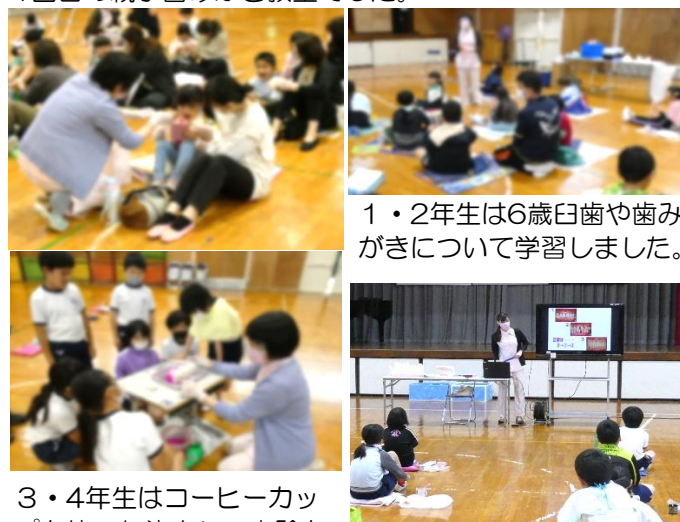
1・2年生は6歳臼歯や歯みがきについて学習しました。

5月23日（火）に、歯科衛生士の方をお招きして、歯科健康教育を行いました。1年生は、家庭教育学級第1回目の親子歯みがき教室でした。