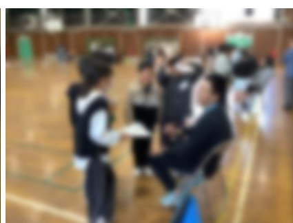
2, 4, 5年国際交流