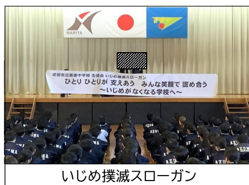
いじめ撲滅スローガン

12月12日（金）「いじめを許さない学校」宣言集会を開き、現在行っている各学年の取組を報告し合い、あらためていじめ撲滅スローガン『ひとりひとりが支えあう みんな笑顔で認め合う ～いじめがなくなる学校へ～』を全校生徒で確認しました。会の中で生徒会長から「コミュニケーションをとることが不可欠な学校生活では、誰もが被害者にも加害者にもなり得ると思います。これらの問題を他人事としてとらえず、この会をいじめにについて考えるきっかけにしましょう」という力強い言葉に続いて、「生徒会はこの場でいじめ撲滅を宣言します」といういじめ撲滅宣言が行われました。今回掲げられたスローガンのもと、いじめを生まない風土づくり、そしていじめのない学校の実現に向けてみんなで歩んでいきましょう。