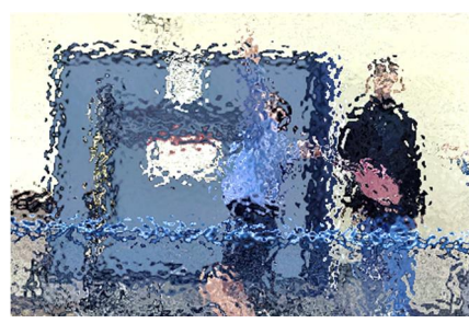
【基礎基本を積み重ねる女子テニス部は、サービスエースを決めます！】