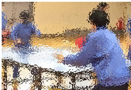
【基礎練習を見せた後、試合も実演した男子卓球部。かっこいいですね】

9日(火)、2、3年生による「新入生歓迎会」が行われました。1年生の楽しみの一つは部活動。この日のために、各部が趣向を凝らして、部の雰囲気や活動内容を紹介しました。