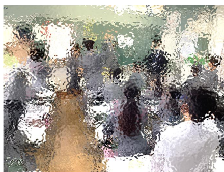
【新しい掃除分担を決める2年生。木工室やトイレなどは、今も昔も人気の場所。希望者が多い場合は、ジャンケンで決めます。希望してもしなくても、今年も黙々と、きれいに磨き上げましょう】