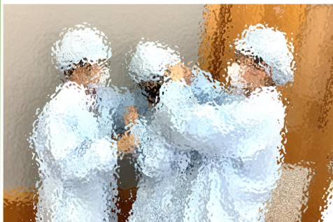
【まずは白衣を着装。髪をきちんとしまえるように、お互いにチェック】

9日(火)から、1年生も給食が始まりました。よりスムーズな準備や片付けなどを学んでもらうべく、3年生が1年生の教室に行き、白衣の着方から、食缶の運搬、配膳まで、レクチャーしました。