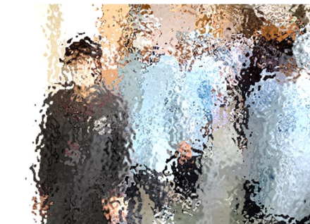
【白衣を着たら、いざ配膳室へ。3年生の誘導で、並んで向かいます】