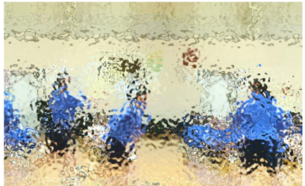
【明るい挨拶で始まったバスケットボール部は、走ってパスして奮闘しました】