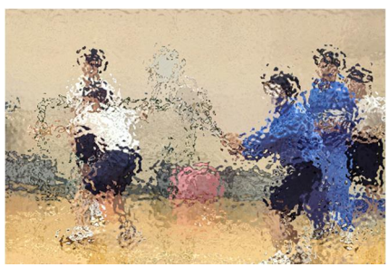
【狭い体育館も何のその。男子テニス部は、いつだって全力です】