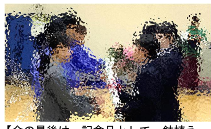
【会の最後は、記念品として、鉢植えと、歌詞を書いたポスターが1年生に贈られました。心に花を、唇には歌を】