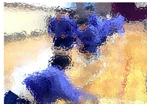
【体育の授業、中台中名物の長縄に挑戦した3年生。ブランクがあったにもかかわらず、ぐんぐん跳ぶことができ、幸先のよいスタートになりました。今年の体育祭が、今から楽しみです】

今週は、各学年が、いろいろと動き出しました。学級目標や学級組織をしっかり決めて、力強く漕ぎ出したら、あとはひたすら、みんなで力を合わせて漕ぎ続けていきましょう。日々の係活動や清掃、授業など、当たり前なことを当たり前に取り組んでこそ、大きな行事で力を発揮できるようになるのですから。毎日の活動を、これからも大切に積み重ねていくことを、心から期待しています。