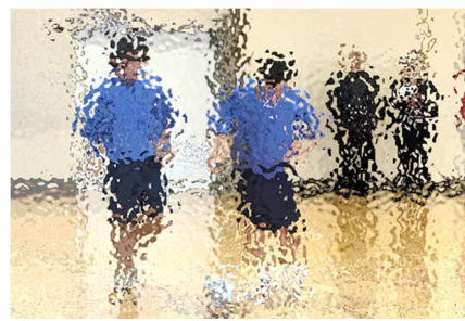
【パス練習を披露するサッカー部。軽やかなフットワークがお見事】