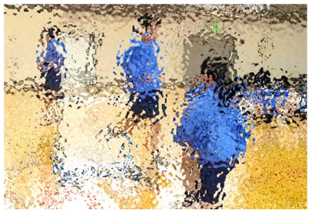
【陸上部は様々な種目や練習方法を見せてくれました。充実していました】