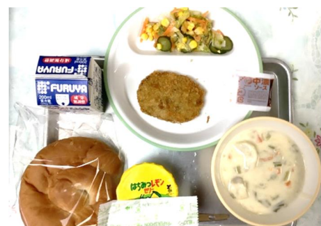
【中学校生活で最初の給食は、菜の花コロッケ、蕪のクリーム煮、スライスパン、マリネサラダ、ゼリー、牛乳。1A、1Bとも準備を滞りなく済ませると、楽しそうに会話しながら食べていました】