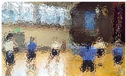
【ミニゲームを披露してくれたバレーボール部。スパイクが突き刺さる！】