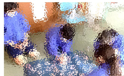
【翌日、1年生は、お礼のメッセージカードを掲示物にしていました】

この他に、生徒会活動や委員会活動の紹介もあり、学校生活の維持や向上を、生徒が主体となって進めていることを知る機会になりました。1年生が、学校生活に慣れ、一人ひとりの持ち味を発揮できるように、様々に工夫を凝らして、2、3年生が今日の歓迎会を企画しました。これからの1年生の活躍に、期待が高まります。