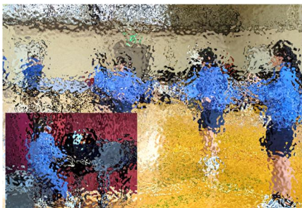
【女子卓球部はピアノに合わせて「卓球体操」を披露。楽しさが伝わります】