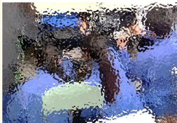
【プリントから衣類まで、いつでも何でも寛容に受け入れてくれたロッカーも、感謝を込めて整頓】