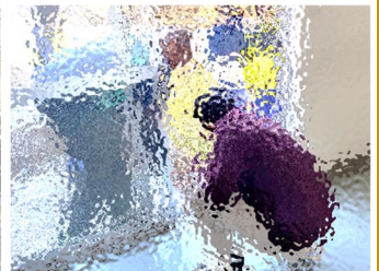
【Thank you for cleaning!】