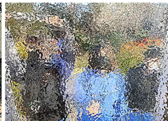
【ワイパーで窓拭き。終わった後は、ほんとうに部屋の明るさが違います】