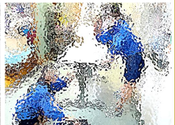
【保健室も隅々まで。光を入れて、テーブルも床も丹念に拭いて、さらに明るく清潔に】