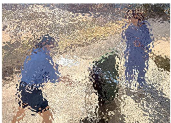
【玄関マットの汚れ落とし。今年の汚れも鬱憤も盛大にたたき落として、新年を迎えよう】