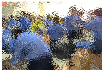
【机の脚に詰まったホコリを丹念に除去。ゴミがごっそり取れたときの、あの達成感ときたら！】

12月19日(木)、全校を挙げて大掃除に取り組みました。普段は手が回らない箇所や、毎日使って汚れが蓄積しているところなど、生徒はよく気付いて、声を掛け合いながら、時間いっぱい、キビキビとよく働きました。まとまった時間で集中して取り組むことができ、成果が目に見えるのは、充実感が得られますね。きれいになった教室で、令和6年を終えて令和7年を迎え、気持ちよくスタートできました。