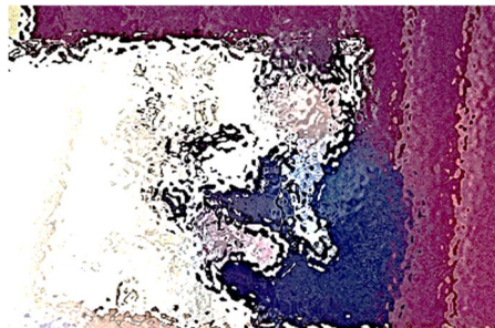
【1年生代表。行事を通して学年学級の協調性の向上を喜び、学習面や生活面での課題を掲げました】