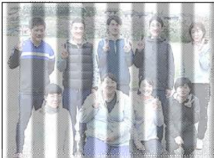
◎3年生H学年、やる気満々元気になスタートです！