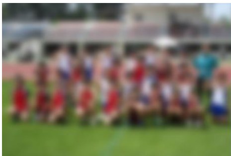
陸上大会参加メンバー 頑張りました！