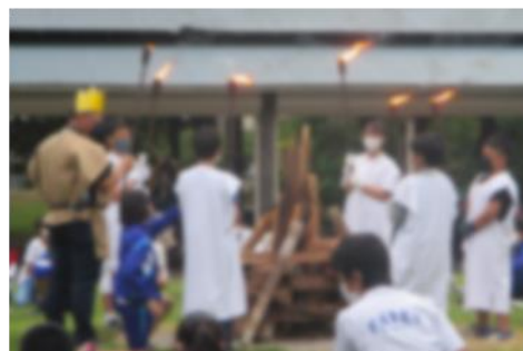
キャンプファイヤー 盛り上がりました！