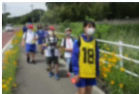
オリエンテーリング 疲れました！

5月26、27日、5年生と7年生は白浜少年自然の家に宿泊学習に行ってきました。準備の段階から5年生と7年生が一緒になって取り組みました。各活動で7年生が5年生をリードし、楽しく充実した時間となりました。同じグループ、同じ部屋で過ごした2日間で新たなつながりが生まれたのではないかと思います。今後の学校生活で生かしてほしいと思います。