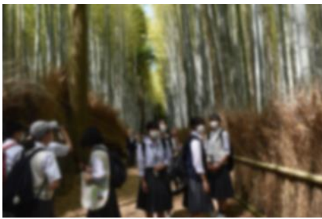
美しい竹林の小径