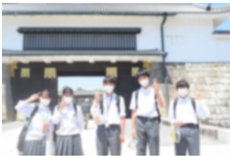
二条城 歴史を感じた？