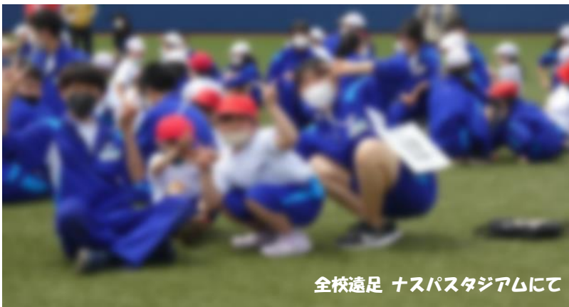
全校遠足 ナスパスタジアムにて

また、今年度は、遠足と同様の24班で縦割り清掃に取り組んでいます。スタート時は、少々緊張感がありましたが、上学年が下学年にほうきの使い方や雑巾でのふき方を教えていくうちに、打ち解けていきました。今では、清掃の時間だけでなく、休み時間にも関わりが見られるようになりました。今後も学校生活のさまざまな場面で縦割りで活動を取り入れていきたいと思ひます。